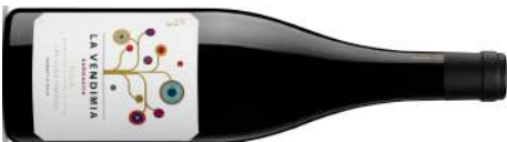
Bodega Palacios Remondo | Espagne–Rioja Rioja 'La Vendimia' 2023 Rouge 21,50 $ JS 90 | CD