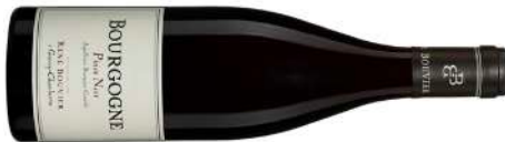
Domaine René Bouvier | France–Bourgogne Bourgogne Pinot Noir 2022 Rouge 36,25 $ CC