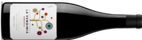
Bodega Palacios Remondo | Espagne–Rioja Rioja 'La Vendimia' 2023 Rouge 21,50 $ JS 90 | CD