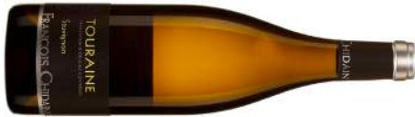
Domaine François Chidaie | France–Loire Touraine Sauvignon 2024 Blanc 22,50 $ CC