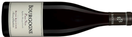
Domaine René Bouvier | France–Bourgogne Bourgogne Pinot Noir 2022 Rouge 33,75 $