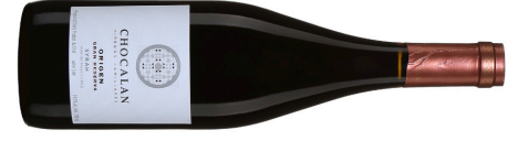
Vinas Chocalan | Chili–Valle del Maipo Syrah Gran Reserva 'Origen' 2022 Rouge 21,35 $ JS 92 | Tim Atkin 92 | CD