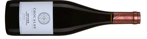
Vinas Chocalan | Chili–Valle del Maipo Syrah Gran Reserva 'Origen' 2022 Rouge 20,05 $ JS 92 | Tim Atkin 92 | CD