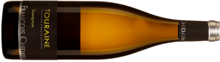
Domaine François Chidaine | France–Loire Touraine Sauvignon 2023 Blanc 19,85 $ CC