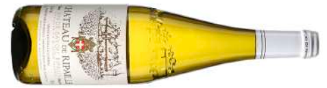
Château de Ripaille | France–Savoie Vin de Savoie 2023 Blanc 19,70 $