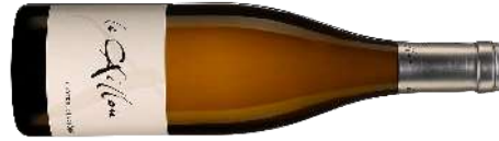
Clos du Caillou | France–Rhône Côte du Rhône 'Le Caillou' 2023 Blanc 22,70 $ CC