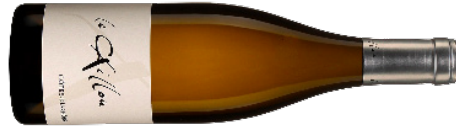
Clos du Caillou | France–Rhône Côtes du Rhône 'Le Caillou' 2023 Blanc 22,70 $ CC