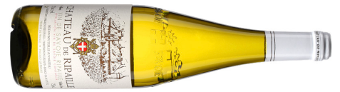
Château de Ripaille | France–Savoie Vin de Savoie 2023 Blanc 19,70 $