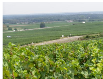
Vue sur le vignoble gibriaçois depuis le Chambertin

Concentré, dense avec un grand équilibre sont les caractéristiques du Chambertin. Il varie peu d'un millésime à l'autre D'une couleur grenat, il est plus sombre et plus corsé que le Chambertin Clos de Bèze